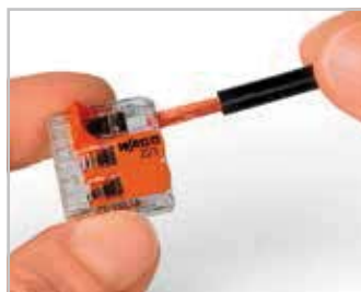
Raccordement du conducteur Ouvrir le point de serrage à l'aide du levier et introduire le conducteur