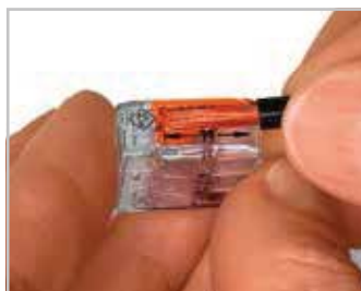
Longueur de dénudage Dénuder le conducteur 11 mm